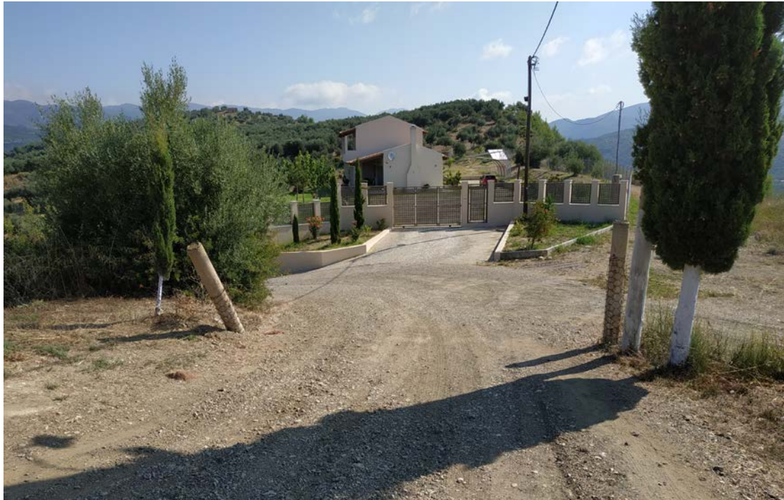
Εικόνα Π1. Η είσοδος στην παραχωρημένη έκταση, όπου θα τοποθετηθεί η μεταλλική πόρτα.